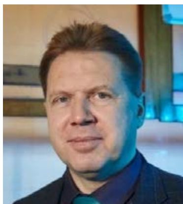
Терентьев Александр Олегович, член-корреспондент РАН.