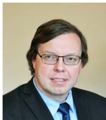
Максимов Антон Львович, член-корреспондент РАН.